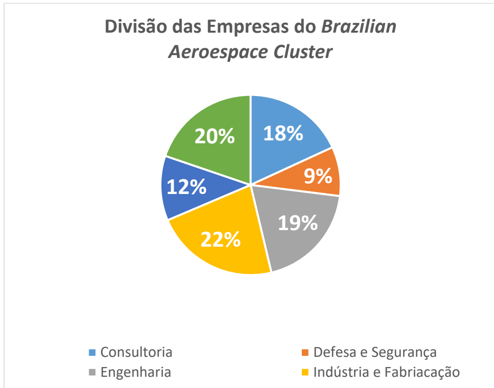
Gráfico 2 - Divisão de Empresas BAC.