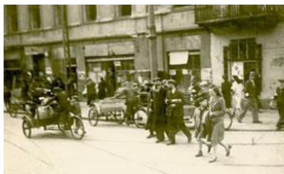
Figura 3. Gueto de Varsóvia, maior gueto judaico estabelecido pelos nazistas na Polônia, durante o Holocausto