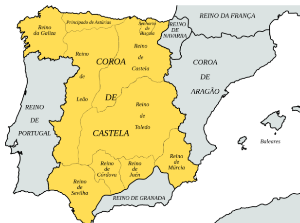
Figura 1. Mapa da Espanha no século XV

Em 1492, com os lucros obtidos com a Inquisição, os monarcas católicos conseguiram expulsar os mouros definitivamente. Ao unificarem politicamente a região, decretaram a expulsão dos judeus. Segundo Abraão Zacuto, cronista da época, 180.000 mil judeus deixaram a região da Espanha.