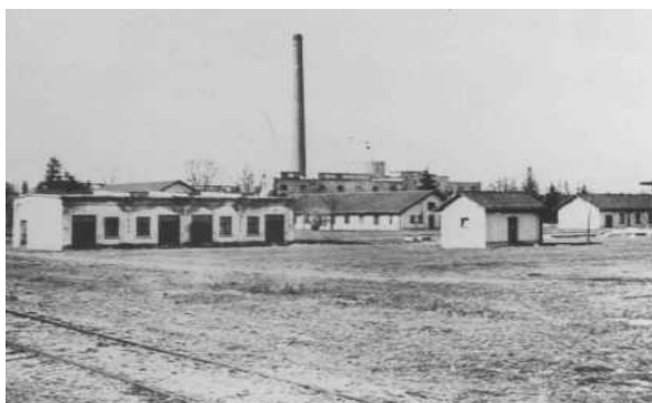
Figura 2. Uma das primeiras fotos tiradas no campo de concentração de Dachau, onde veem-se os barracões [de prisioneiros] e a fábrica de munições. Dachau, Alemanha, março ou abril de 1933.

Dessa forma, de 1933 a 1938 esse sentimento antissemita foi crescendo entre os alemães. Já em 1933 são criados os primeiros campos de concentração. Em 1935 são criadas as Leis de Nuremberg que, em suma, tiravam o direito de cidadania dos judeus. Após a ocupação da Polônia em 1939, os judeus são obrigados a viver nos guetos, regiões urbanas, geralmente cercadas, onde os alemães forçavam a população judaica local a morar, e usar uma faixa amarela no braço, que os identificava como semitas. ( https://www.ushmm.org/ . Acesso em 27 de maio de 2016)